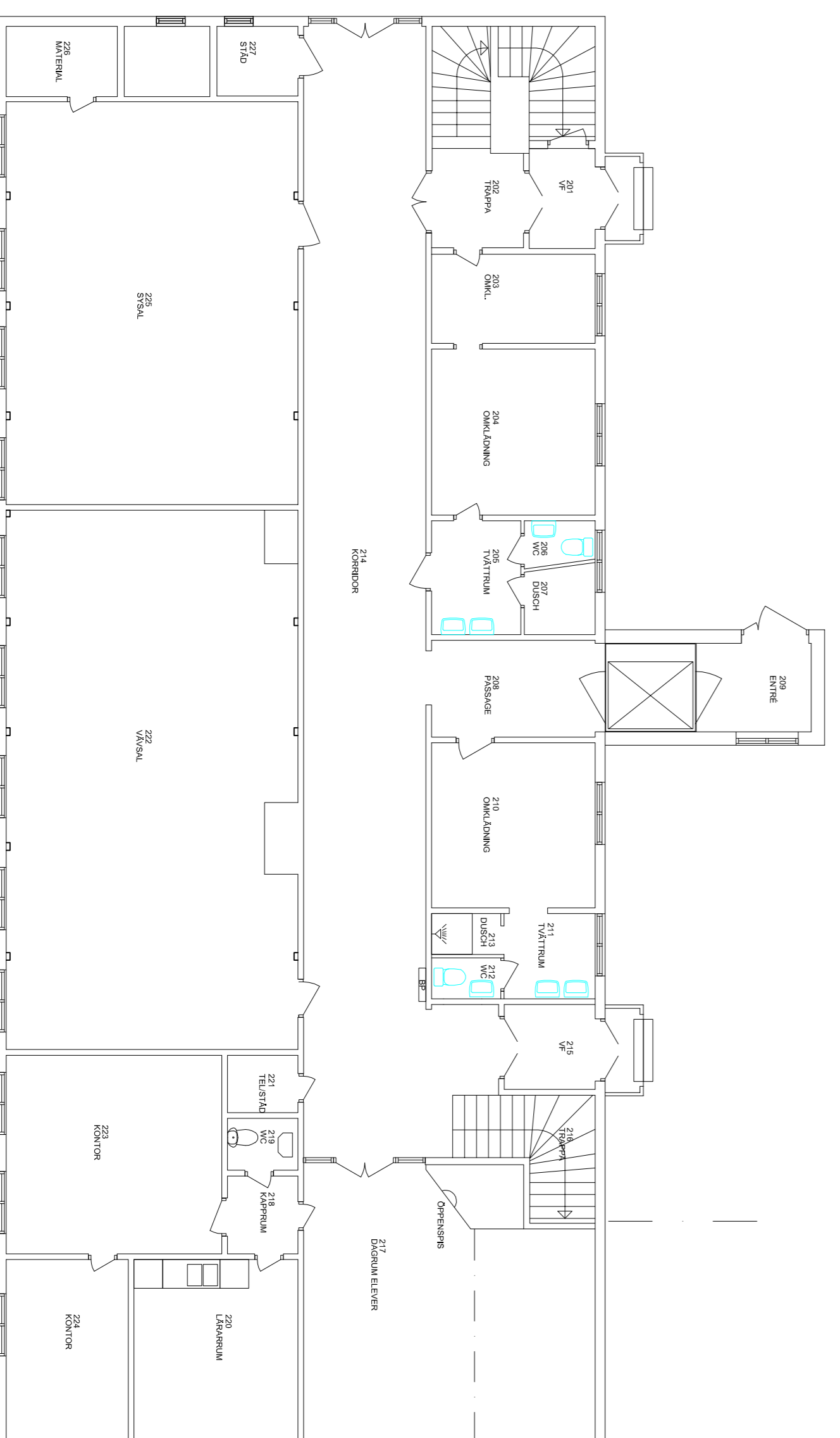
PLAN 2 BOTTENPLAN

OMBYGGNAD PLAN 5 KE 0802 OMBYGGNAD KE 0601